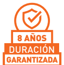
LÁMINA DE POLIÉSTER PARA USO COMERCIAL