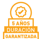
LÁMINA TRASLÚCIDA PARA USO RESIDENCIAL