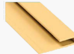
Remate Top A570