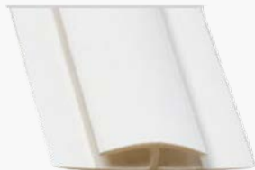
Barra de División