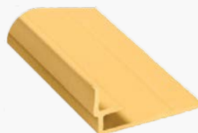
Esquinero Interior A551