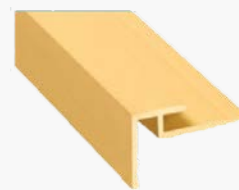
Esquinero Exterior A560