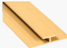
Barra de División A565